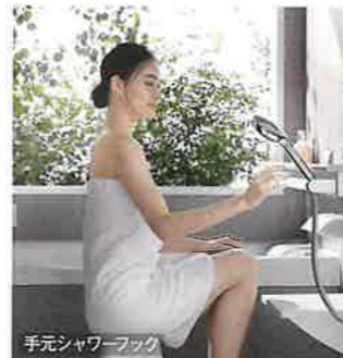
手元シャワーフック