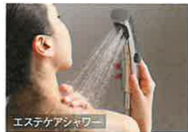
エステケアシャワー

酸素を含んだマイクロの泡が、お湯を白くやわらかく。身体をやさしくあたため、入浴後のお肌のうるおいが長続きます。