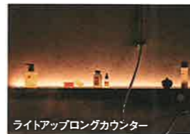
ライトアップロングカウンター