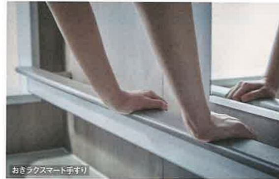
おきラクスマート手すり

立ち座り、移動、浴槽をまたぐ、といった浴室での一連の動作をサポートする手すりです。奥には収納スペースがたっぷりあります。