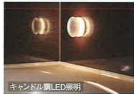
キャンドル調LED照明