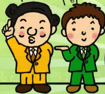
すぽっ!とデン課 節約 黄太郎