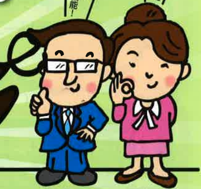
すぽっ!とデン課 快適 青次