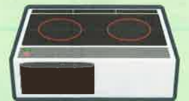
IHクッキングヒーター